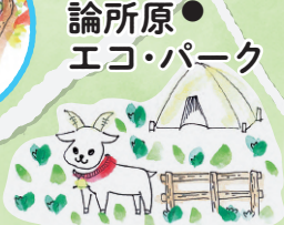
論所原 エコ・パーク