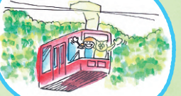
雲仙ロープウェイ