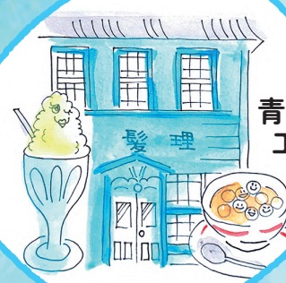
青い理髪館 工房モモ