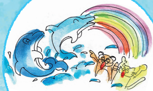
かづさ イルカウォッチング