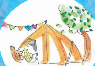
かづさ オートキャンプ場