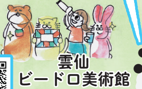
雲仙 ビードロ美術館