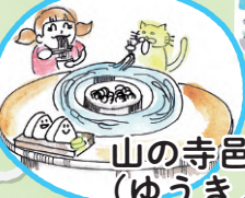
山の寺邑居 (ゆうきょ)