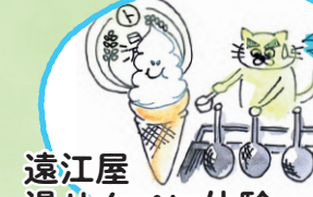
遠江屋 湯せんぺい体験