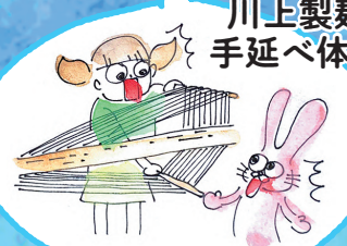
川上製麺 手延べ体験