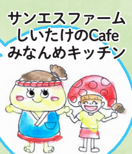
サンエスファーム しいたけのCafe みなんめキッチン